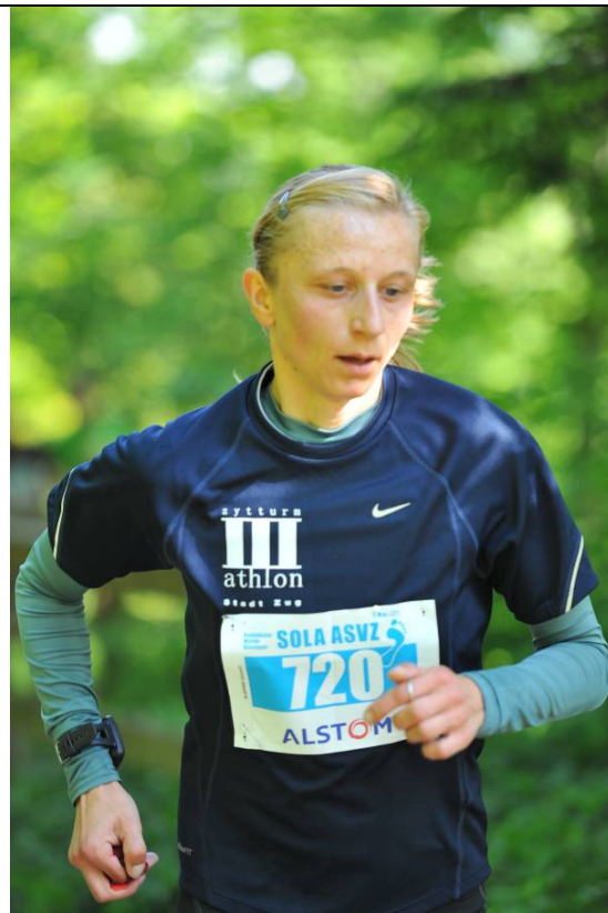
Strecke 3: Man beachte: leicht gerötete Wangen und nur 2 Schichten T-Shirts?