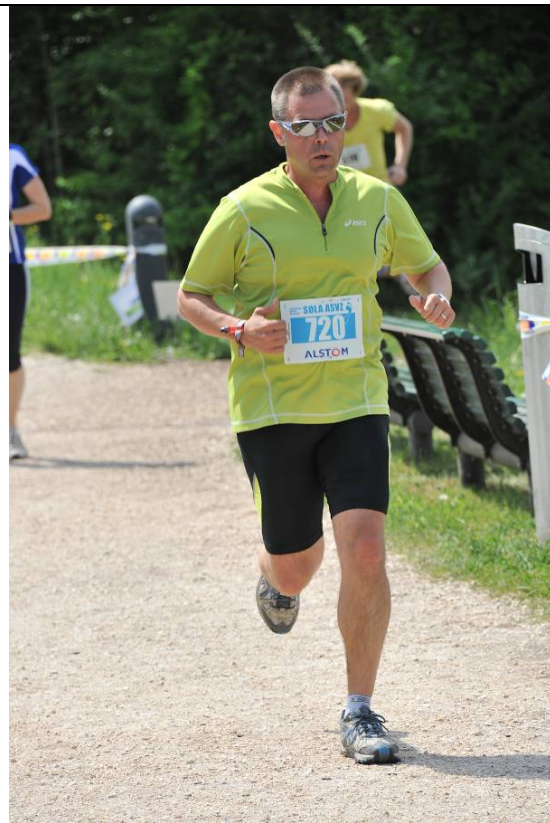
Strecke 7: Schnelle Brille ist die halbe Miete