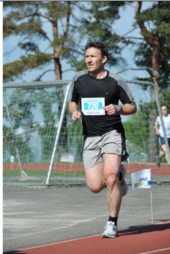
Strecke 13: Nur ein ehemaliger Fussballer und Biker kann auf der 400m-Bahn solche Fliehkräfte aushalten