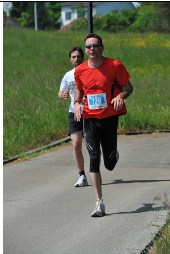
Strecke 6: Kein Radfahrer (im Gegensatz zu Läufer 4 & 5), weil unrasierte, aber schnelle Läuferbeine