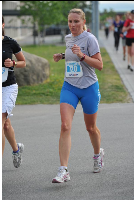
Strecke 1: Konzentriert auf den schönen Laufstil...ist das schon joggen oder noch gehen?