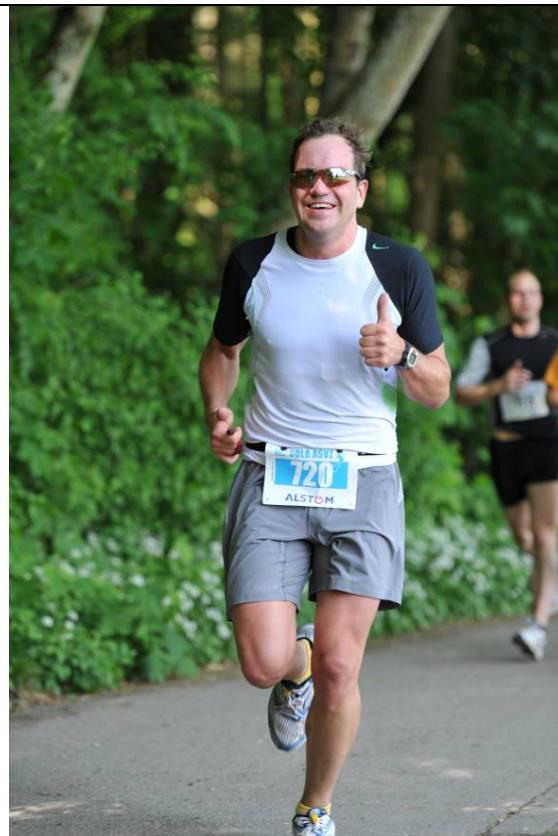
Strecke 5: Hallo!?! Auf der 5 noch Kraft um zu posieren für den Fotografen. Das geht gar nicht!