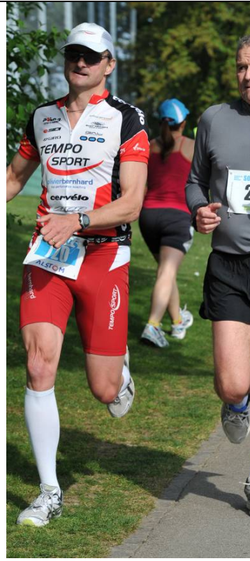
Strecke 2: Gaaanz locker oder war da der Verdauungstrakt antreibend?