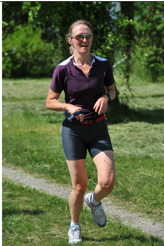
Strecke 10: Lächelnd die Gegnerinnen zumürben...