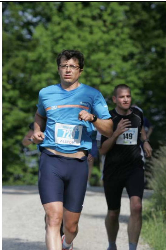
Strecke 4: So locker lief der noch nie zur Felsenegg! Und wo sind die 95kg?