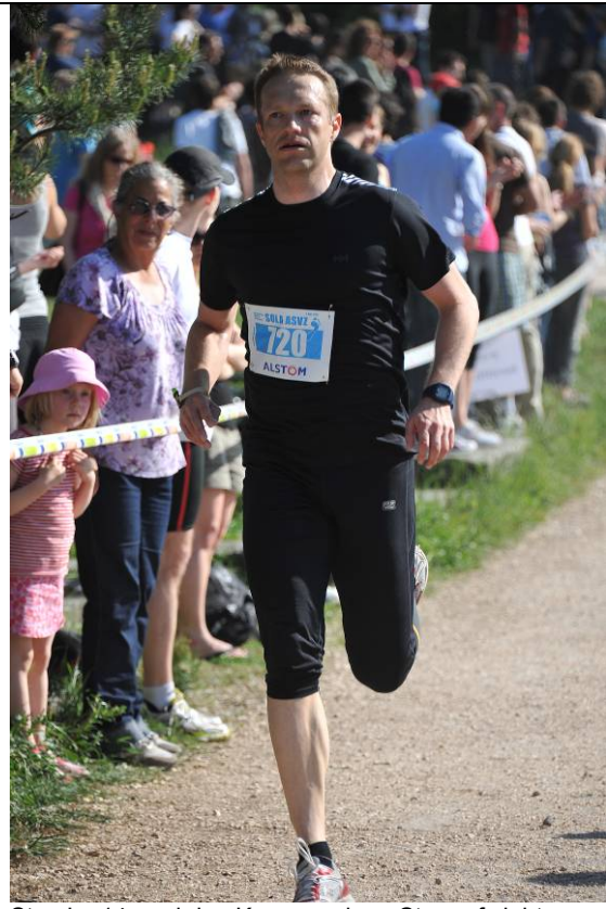
Strecke 14: und den Kompressions-Strumpf sieht man nicht ;-)