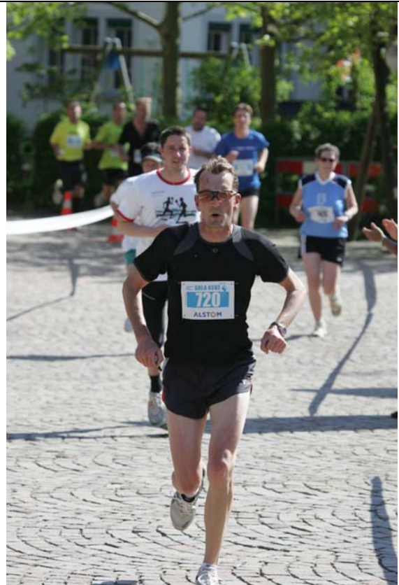
Strecke 11: Ellenbogen sind ausgefahren; mich überholt niemand mehr!