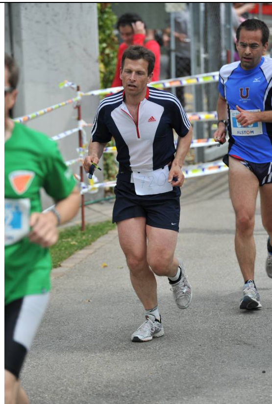
Strecke 8 Was für Skilehrer und Sprinter-Beine!